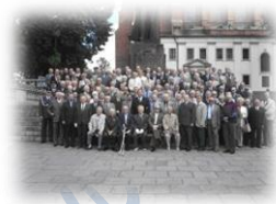
W Gnieźnie przed pomnikiem B. Chrobrego