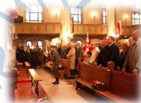
w Kościele Garnizonowym w Gnieźnie