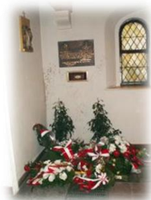
Po uroczysto- ściach